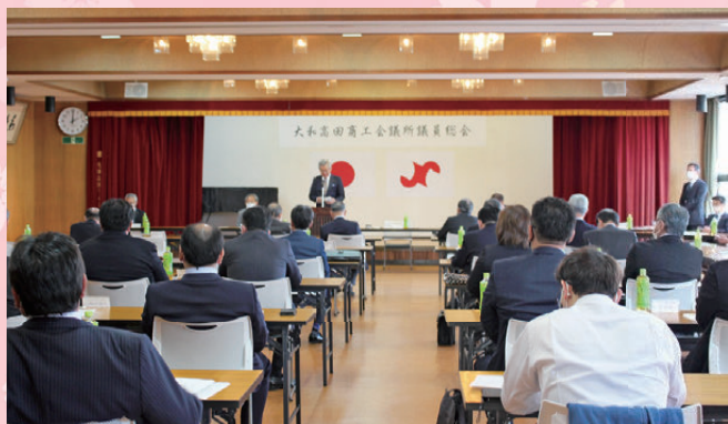
第153回通常議員総会